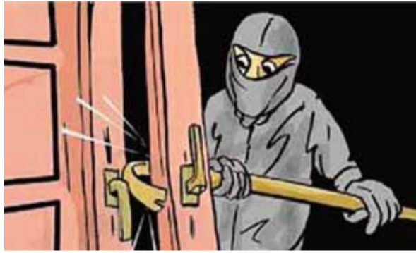
हरिभूमि न्यूज/ गाइरवारा।

बताया जाता है कि समीपस्थ ग्राम बोहानी स्थित नवोदय विद्यालय की चौकसी व्यवस्था इतनी तेज है कि परिन्दवा भी पर नहीं मार सकता है। यदि किसी व्यक्ति या अभिभावकों को अपने बच्चों से मिलने जाते है तो पहले उनकी संपूर्ण जानकारी ली जाती है इसके बाद ही उन्हें प्रवेश दिया जाता है। इतनी सख्त व्यवस्था के बीच यदि फूसी कर्मचारी के यहां ताला तोड़कर चोरी की घटना घटित होती है तो निश्चित ही यहां की सुरक्षा व्यवस्था सबालों के घेरे में आने से नहीं चूक पाती है..? कुछ इसी प्रकार की सच्चाई बीते हुये पत्नी उस समय देखने मिली जब नवोदय परिसर में बनी हुई सरकारी